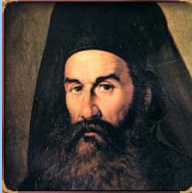
Παλαιών Πατρών Γερμανός