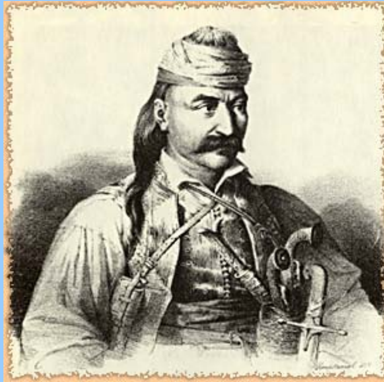
Θεόδωρος Κολοκοτρώνης (1770-1843)