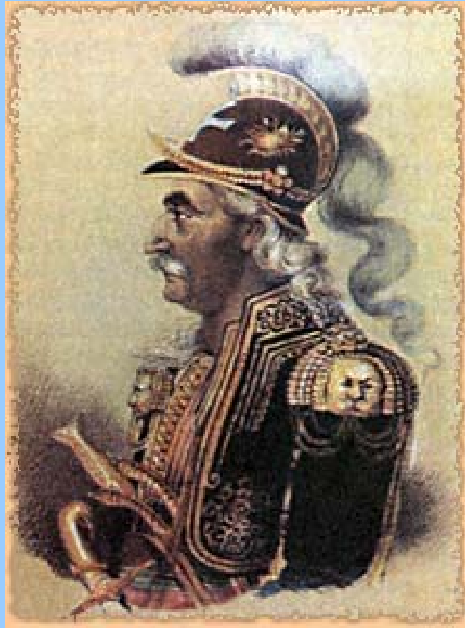
Θεόδωρος Κολοκοτρώνης (1770-1843)