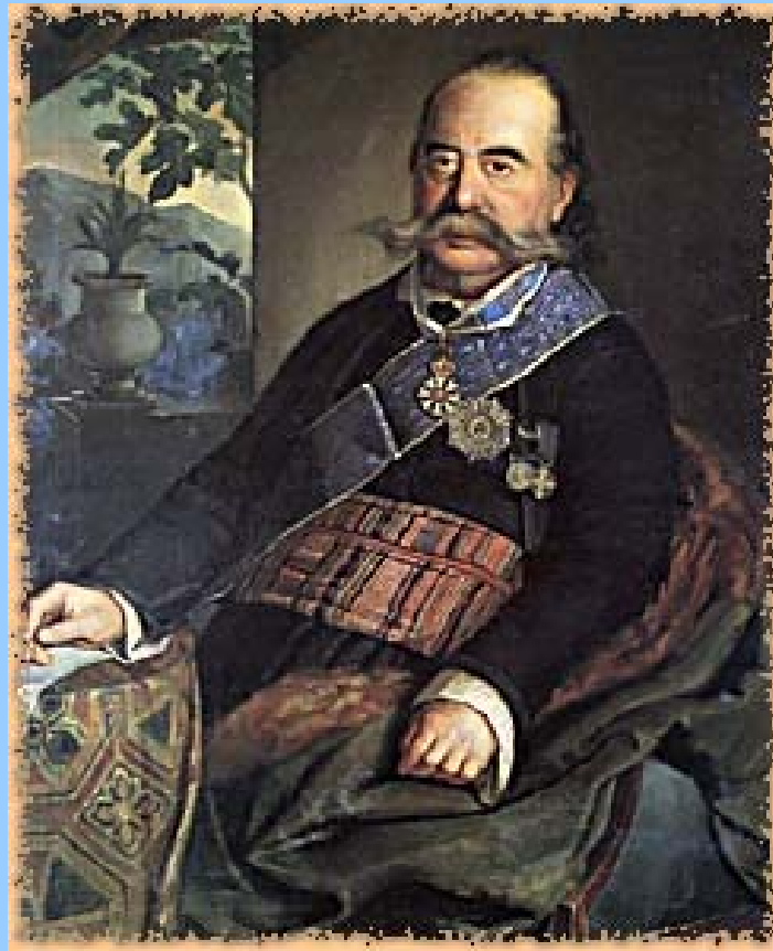
Ο Πετρόμπεης Μαυρομιχάλης (1765-1848)