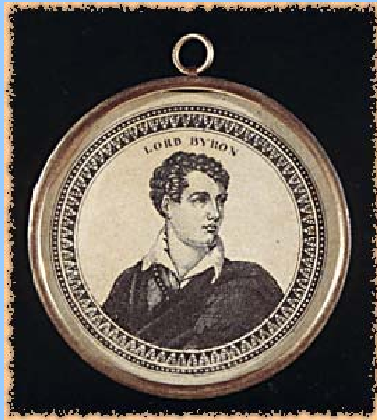
Ο λόρδος Βύρωνας (1788-1824)