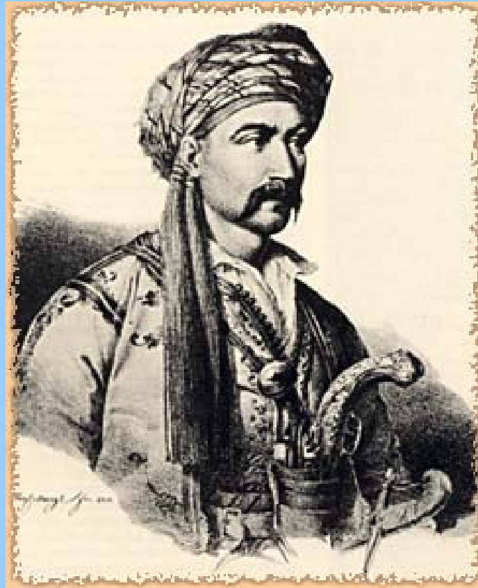
Ο Νικήτας Σταματελόπουλος ή Νικηταράς (1787-1849)